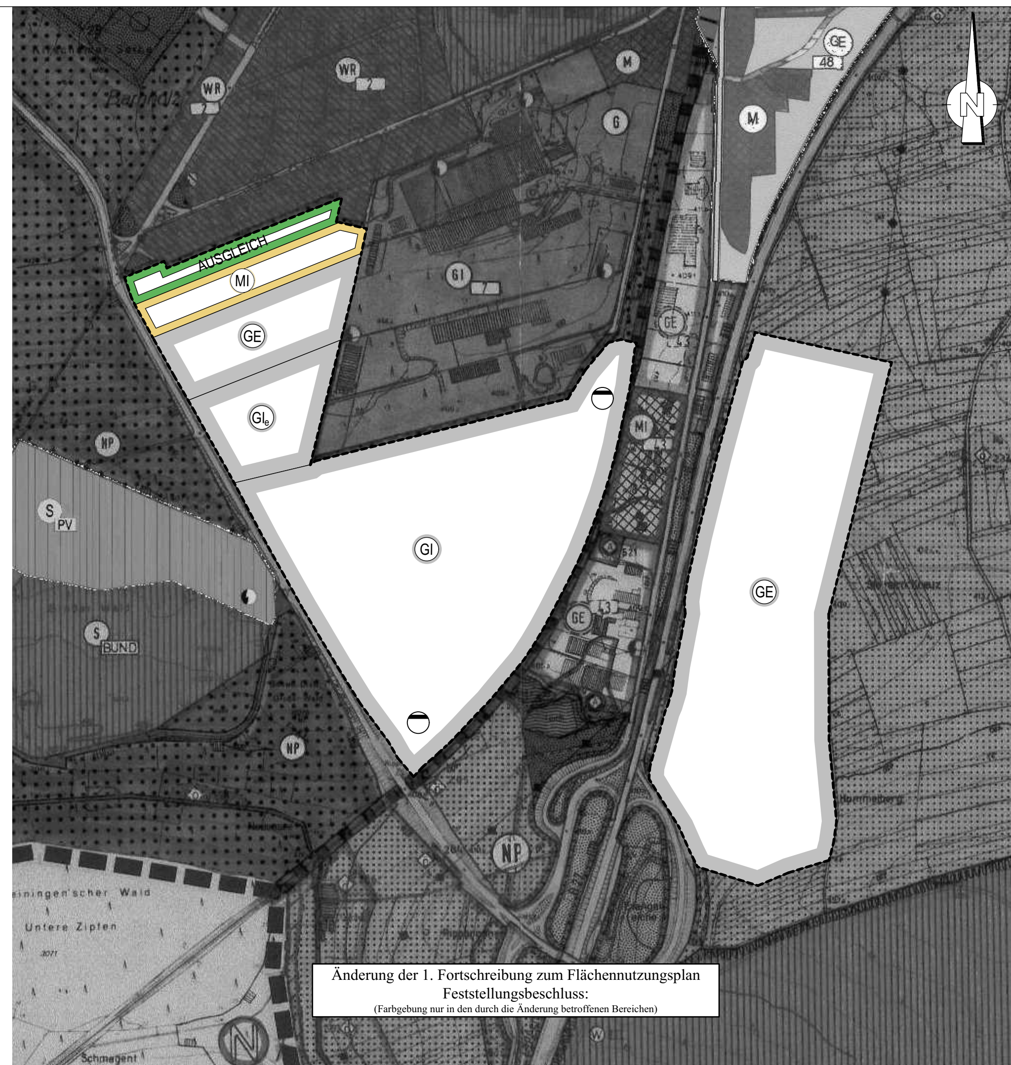
Änderung der 1. Fortschreibung zum Flächennutzungsplan Feststellungsbeschluss: (Farbgebung nur in den durch die Änderung betroffenen Bereichen)