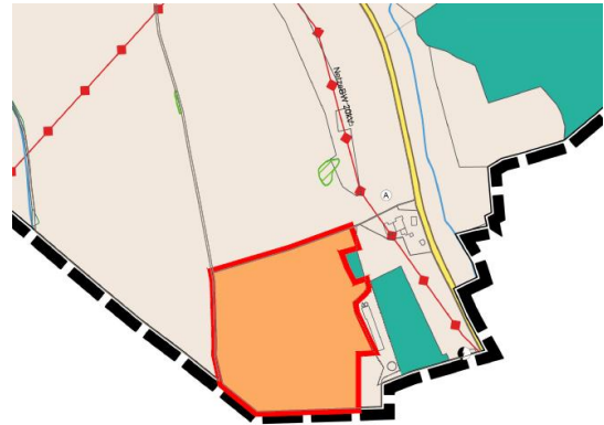
Änderungsfläche Solarpark Gerichtstetten II

Die Flächenbilanz zeigt die Änderung der Nutzung der natürlichen Ressource Fläche im Gebiet.